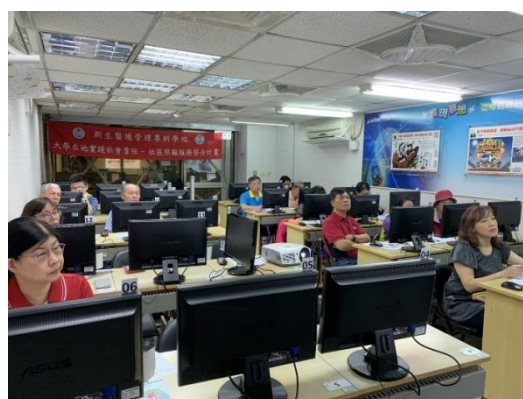
協助社區據點參與「預防及延緩失能照護計畫」(團體輔導)