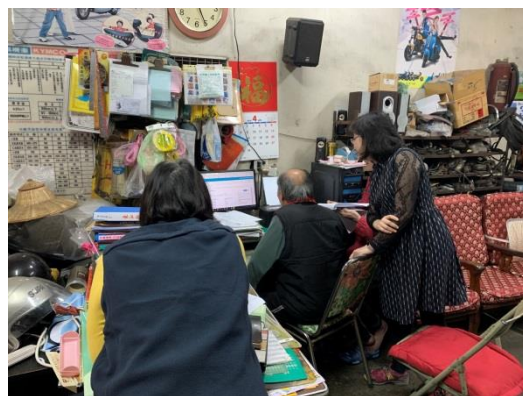
協助社區據點參與「預防及延緩失能照護計畫」(個別輔導)