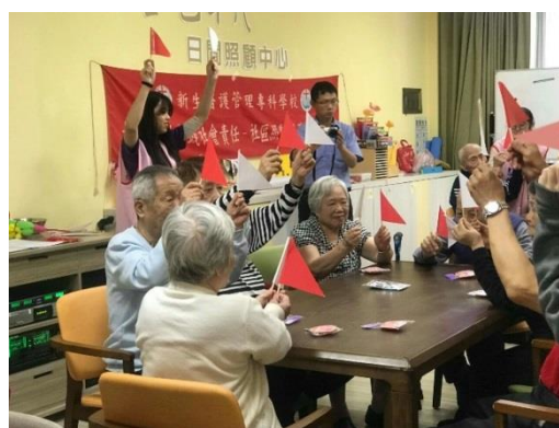
幼保科學生進行社區照顧志願服務活動