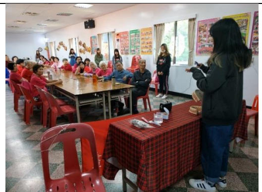
口衛科學生進行社區照顧志願服務活動