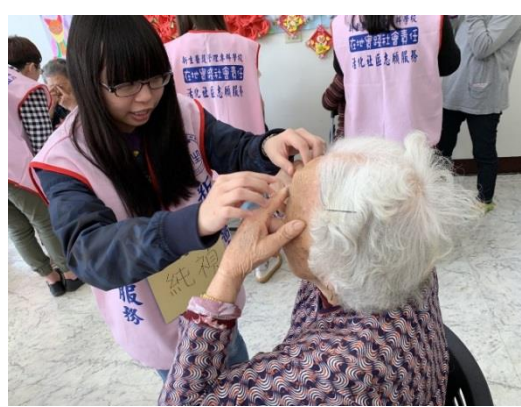
視光科學生進行社區照顧志願服務活動