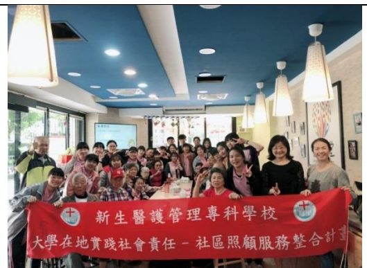
護理科學生進行社區照顧志願服務活動