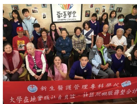
護理科學生進行社區照顧志願服務活動