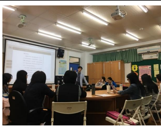
說明生命故事系統應用