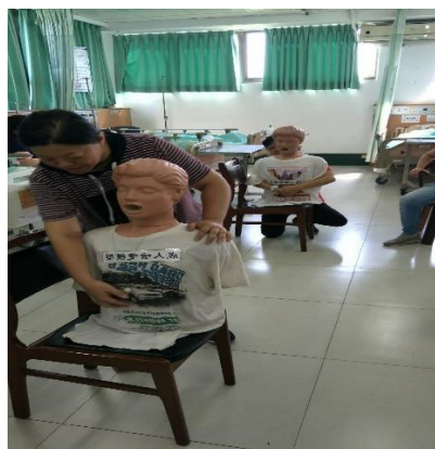
回覆示教課程-成人心肺復甦術、異物哽塞急救法