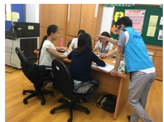
講師指導學員桌遊