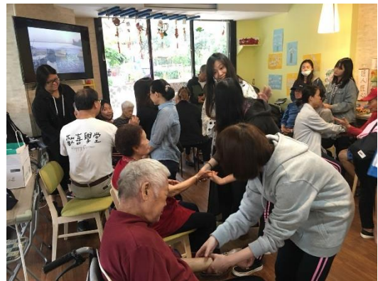
美容科學生進行社區照顧志願服務活動