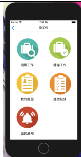
目前建置 app 之草稿圖