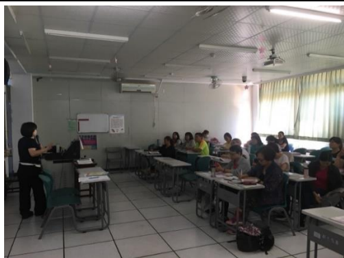
學理課程：照顧服務員功能角色與服務內涵