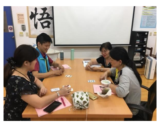
講師實際帶領玩桌遊