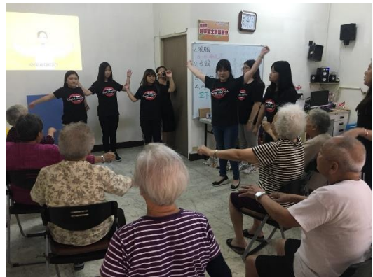
口衛科學生進行社區照顧志願服務活動