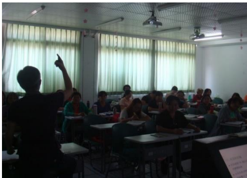
學理課程：心理健康與壓力調適