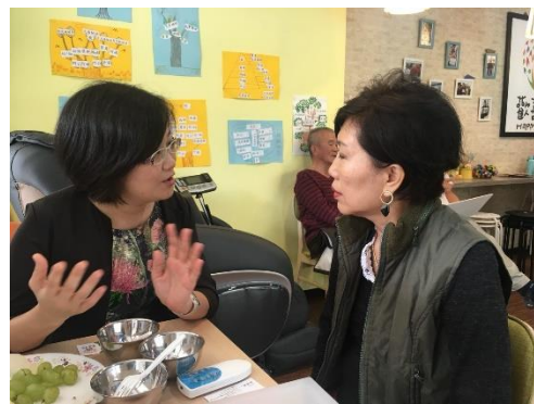
輔導失智據點-桃園市歡喜學堂認知休憩站