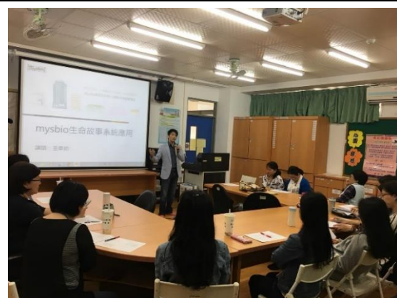
主題：mysbio生命故事系統應用