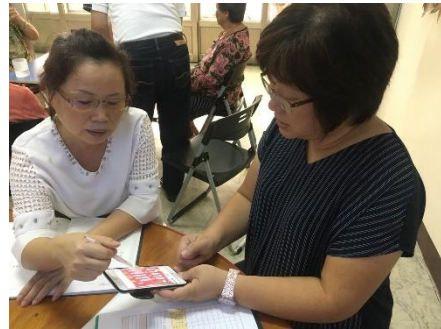
輔導失智據點-歸寧宮文教功德會