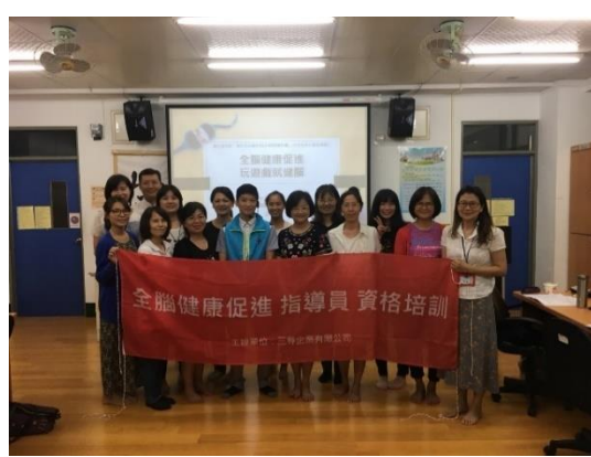
全腦健康促進-指導員培訓