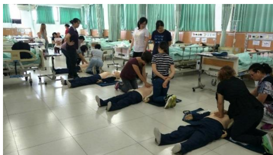
學理課程：意外災害的緊急處理